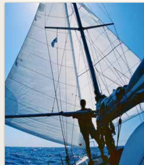
"Eigenlijk ging het allemaal zeer vanzelf."