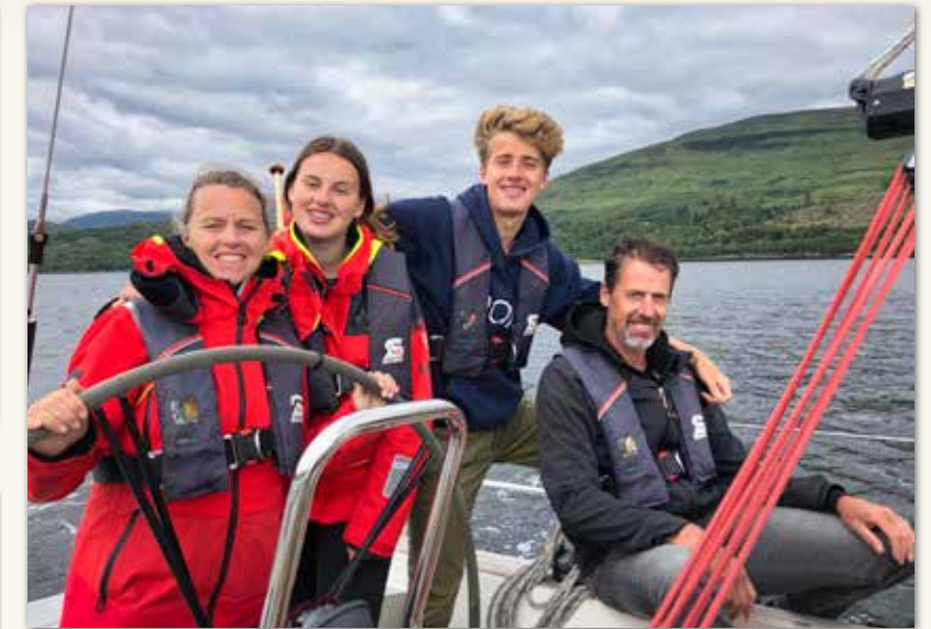
Ook de kinderen zijn zeilend opgegroeid.