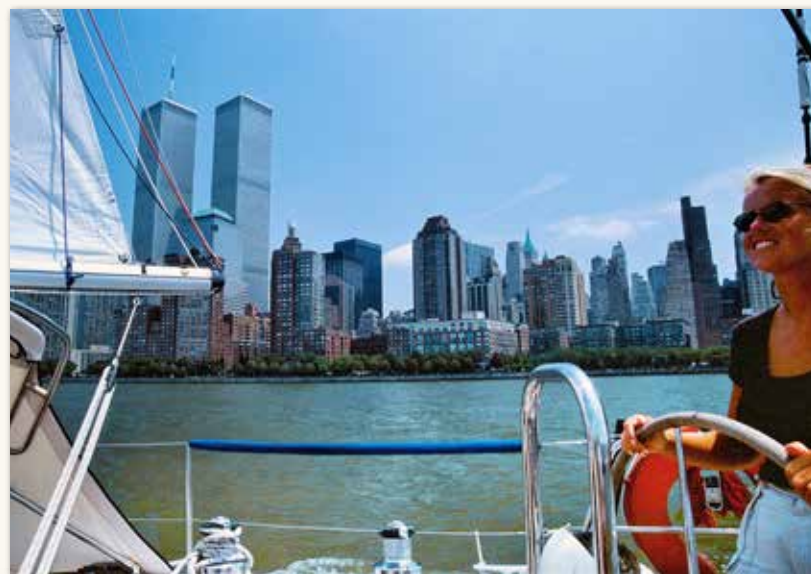
New York, New York!